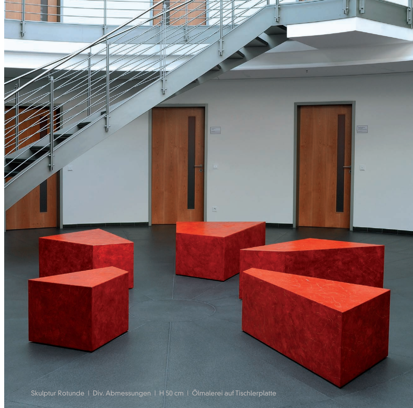
Skulptur Rotunde | Div. Abmessungen | H 50 cm | Ölmalerei auf Tischlerplatte

Architektur Architekturbüro Dietz | Bamberg